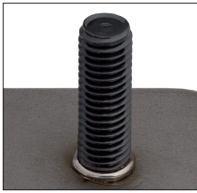
Hochfester Bolzen HZ-1 perfekt mit SRM® geschweißt High-strength weld stud HZ-1 perfectly welded using SRM®