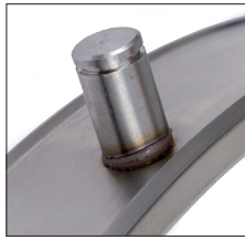
Kleiner, gleichmäßiger spritzerfreier Schweißwulst Small, regular and spatter-free weld collar